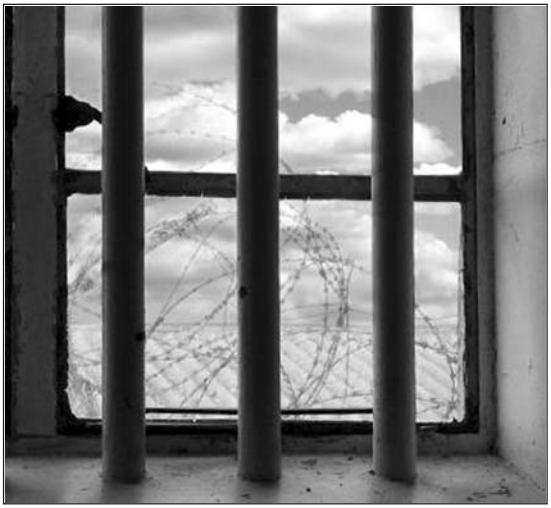
روانی مربوط به جنس مخالف است.

و ایشان را درد و رنج بی‌پایان همراه کرده است. مددکار مرکز مداخله‌ی بهزیستی گفت: کودک از سن ۳ سالگی از جنسیت خود شناخت دارد اما افراد مبتلا به اختلال هویت جنسی (TS) این شناخت از جنسیت خود ندارند. آنها از جنسیت خود ناراضی هستند و نمی‌توانند با آن کنار بیایند. وی خاطرنشان کرد: این افراد نقش‌هایی که می‌پلیرند، طرز لباس پوشیدن، حرکات و رفتارشان و حتی از لحاظ روحی و