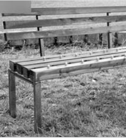
برای نشستن روی این نیمکت در پارک در مدت معین باید پول پرداخت کرد در غیر اینصورت زاید‌های خارمانند اجازه‌ی نشستن نمی‌دهند.

مهمان در بازرجویی‌های تخصصی در پلیس آگاهی استان به ۱۹ مورد سرقت شامل ۹ مورد سرقت مغازه، ۶ فقره سرقت منزل و ۴ فقره سایر سرقت‌ها اعتراف کردند.