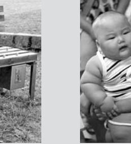
برای نشستن روی این نیمکت در پارک در مدت معین باید پول پرداخت کرد در غیر اینصورت زاید‌های خارمانند اجازه‌ی نشستن نمی‌دهند.