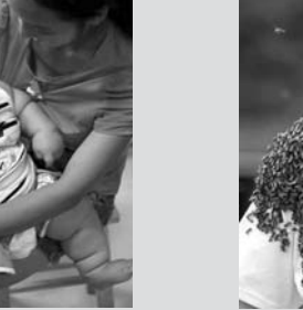
چاق ترین نوزاد چینی. وی ۱۰ ماهه است؛ اما وزن یک کودک ۶ ساله را دارد. این نوزاد هم اکنون ۲۰ کیلو وزن دارد.