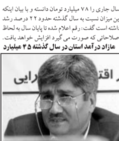
رئیس سازمان امور اقتصادی و دارایی استان:

رئیس سازمان امور اقتصادی و دارایی استان قزوین در ادامه اعتبار مصوب تملک دارایی و سرمایه ای استان طی